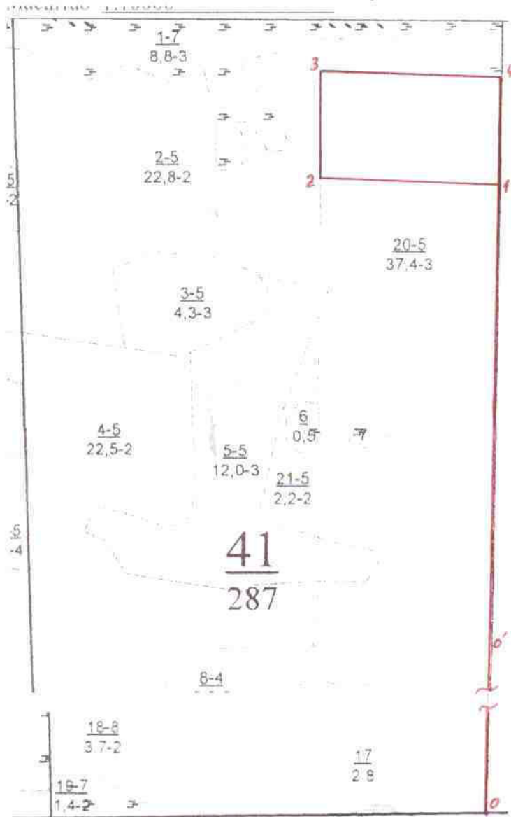
План участка, масштаб 1:10000

Участковое лесничество Краснооктябрьское, лесной участок _____ Арендатор лесного участка: ООО «ЛХП Таволга» Номер квартала 41 , номер выдела 20 , площадь участка 6,8 га , Группа лесов 2 , категория защитности эксплуатационные , главная порода сосна , сопутствующие породы _____ Вид культур – сплошные культуры сосны